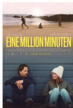
Eine Million Minuten 19:30 Uhr | 5€ | FSK0

Die Landfrauen Hausen und die Fußballer des TV Hausen laden zum Mobilien Kino ein.