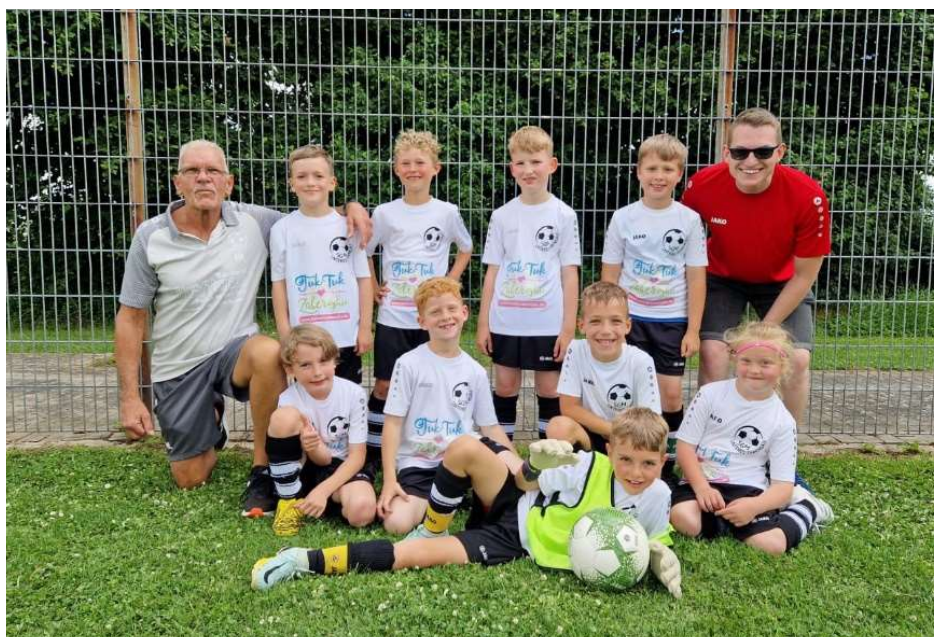
SGM Unteres Zabergäu - F-Jugend