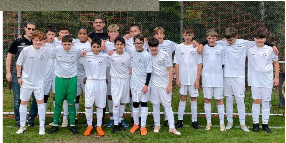
SGM Unteres Zabergäu - C-Jugend