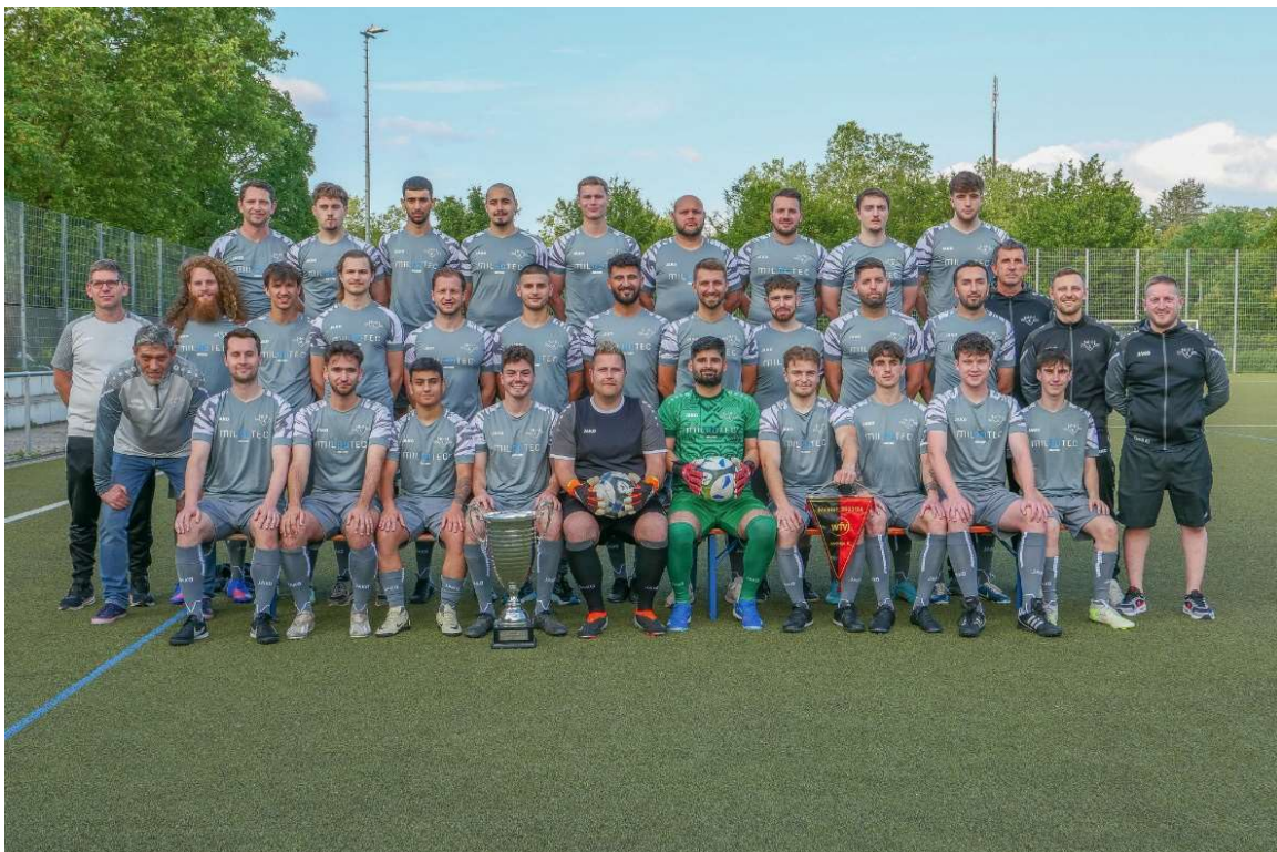
SGM 2018 NordHeimHausen – Aktive Mannschaft